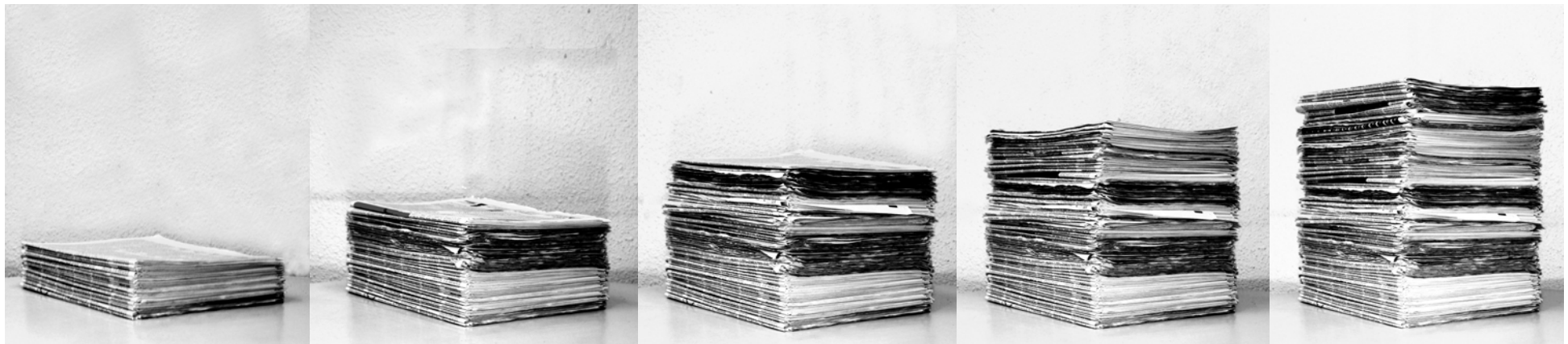
nach 2 Wochen